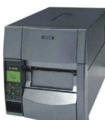
DRUKARKI KODÓW KRESKOWYCH