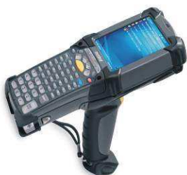
PRZENOŚNE KOREKTORY DANYCH