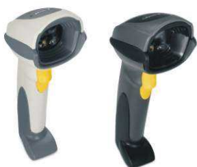
CZYTNIKI KODÓW KRESKOWYCH